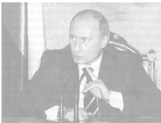
Рис. 30. Президент Российской Федерации В . В . П у т и н

Развитие философской мысли и исторической практики во второй половине XIX — XX вв. вызвало к жизни понятие социалистическая республика, соответствующая социалистическому типу государства.