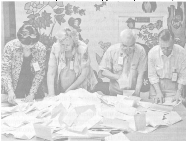
Рис. 32. Подсчет бюллетеней на избирательном участке

Выделяют следующую классификацию выборов. Всеобщие выборы — это выборы, в которых участвуют избиратели всей страны (например, президентские и парламентские выборы). Частичные дополнительные выборы — это выборы, которые проводятся в отдельном избирательном округе по причине досрочного выбытия депутата.