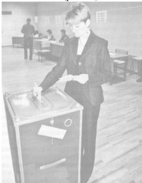
Рис. 31. На избирательном участке

Гражданин РФ может избирать и быть избранным независимо от пола, расы, национальности, языка, происхождения, имущественного и должностного положения, места жительства, отношения к религии, убеждений, принадлежности к общественным объединениям (рис. 31).